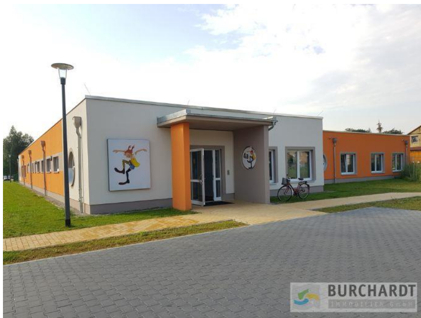
Hort Pippi Langstrumpf