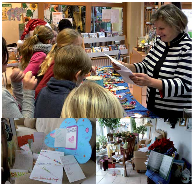
Zur Verabschiedung gab es viele Überraschungen.