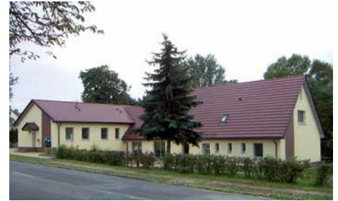
Im Haus der Generationen finden die meisten Treffen des Heimatvereines statt.