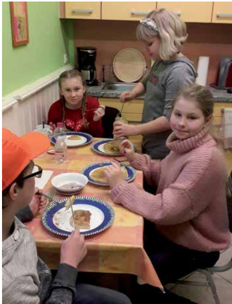
Schnell zubereitet und lecker - Eierkuchen.

Es wurden Waffeln und Eierkuchen gebacken und eine schmackhafte Lasagne zubereitet.