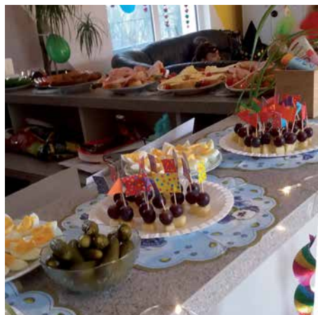
Wie immer so auch zum Fasching gab es ein leckeres Buffet.