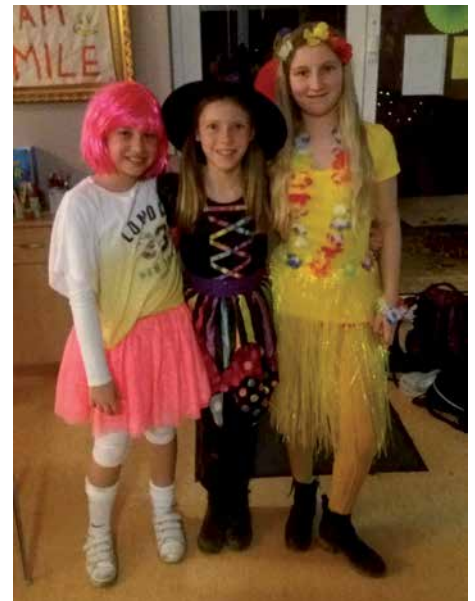
Fasching und Kostüme gehören zusammen.

Spiele durften natürlich nicht fehlen und so wurde Stopptanz, Schaumkuss-Wettessen, Luftballonspiele und vieles mehr gespielt. Zu fortgeschrittener Stunde ging ein schöner Nachmittag/Abend zu Ende.