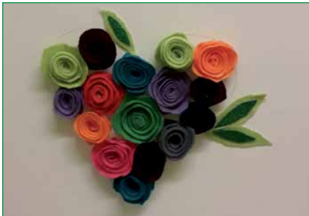
Dieses Bild wurde aus Filz gearbeitet

Um am 14. Februar seine Lieben zum Valentinstag zu beschenken, hatten die Kids wieder viele kreative Ideen.