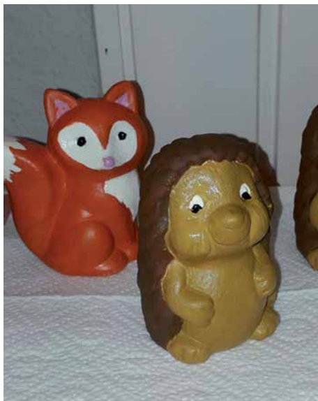
Diese possierlichen Tiere sind Spardosen.