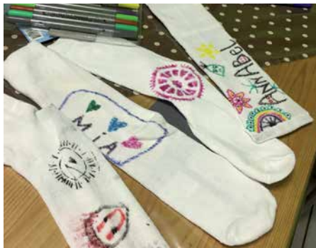
Weißer Socken wurden zu Unikaten.

Es ist immer wieder schön mit anzusehen, welcher Ideenreichtum in den Köpfen der Kinder existiert und wie liebevoll die Geschenke gestaltet werden.