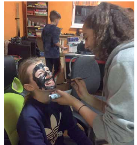
Schöne gesunde Haut mit Aktivkohlemaske.

So wurde Musik gehört, Armbänder gebastelt und amüsante Spiele gespielt. Für die Schönheit trug man sich gegenseitig Gesichtsmasken auf. Der Hunger wurde wirksam mit Hot Dogs bekämpft.