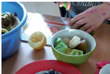
Bevor Obst und Gemüse zu Smoothies werden, muss es geputzt und geschnippelt werden.

Es wurden Smoothies aus Obst und Gemüse hergestellt. Die Kids durften die Zutaten auswählen, die in ihr Getränk kommen sollten.