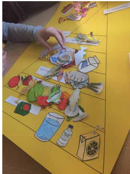
Wo ist die richtige Stelle in der Lebensmittelpyramide für das jeweilige Lebensmittel.

Gemeinsam wurde eine Ernährungspyramide erstellt, die aufzeigt, welche Lebensmittel wie oft am Tag gegessen bzw. getrunken werden sollten.