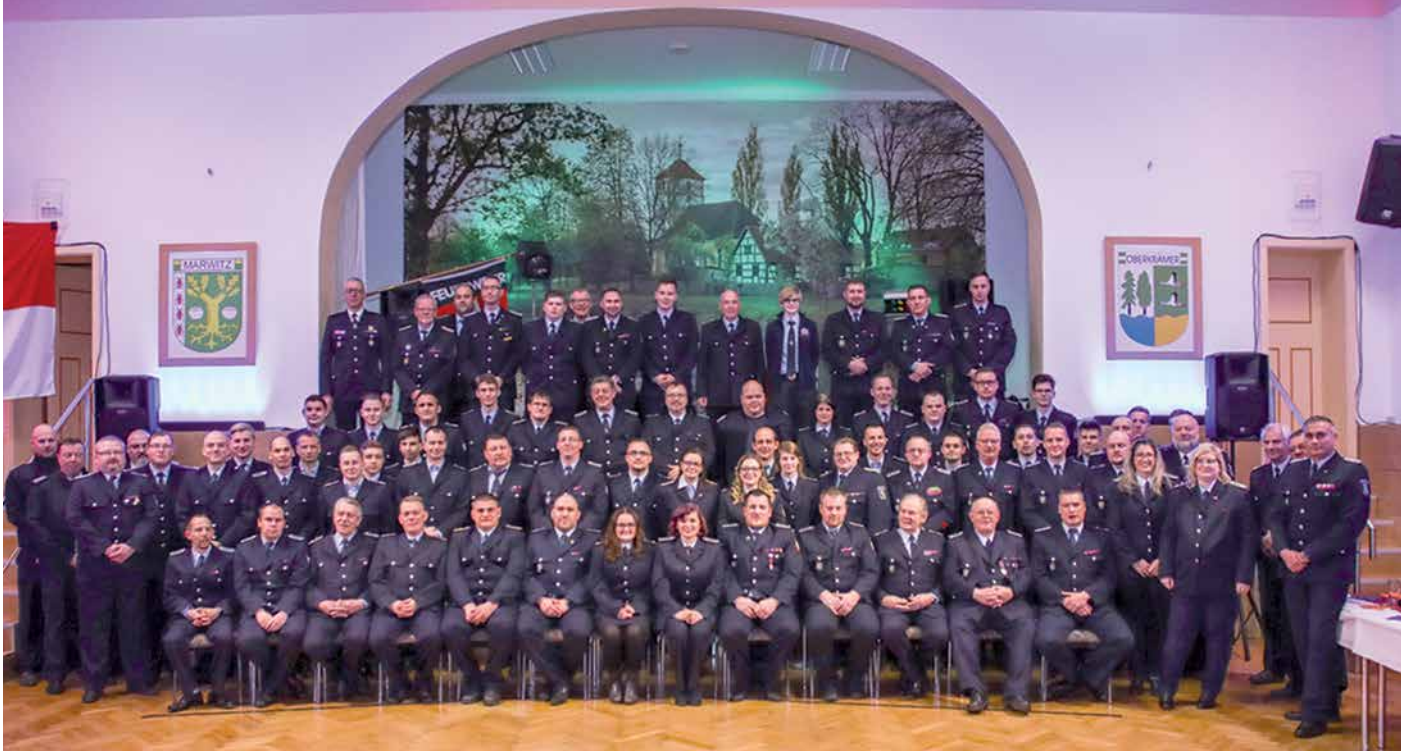
Die Teilnehmer der Jahreshauptversammlung unserer Freiwilligen Feuerwehr.