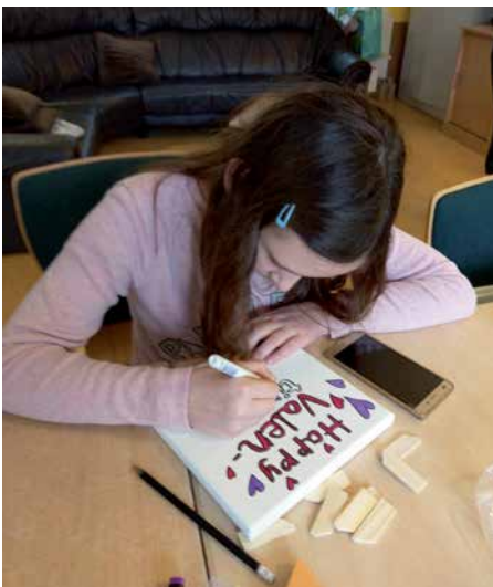
Mit viel Liebe wurde gestaltet.

Andere Clubbesucher malten Bilder, schrieben kleine Gedichte oder gestalteten Keilrahmen.