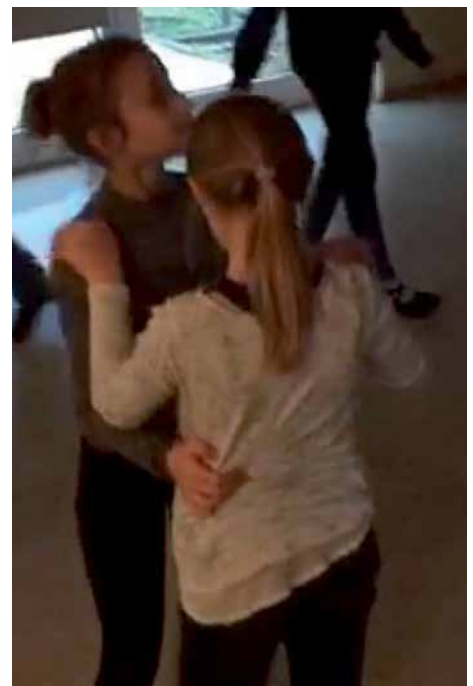
Auf die richtige Tanzhaltung ist zu achten.

Zum Ende des Tanzkurses ist ein Abschlussball geplant, bei dem die erlernten Tänze den Eltern vorgeführt werden.