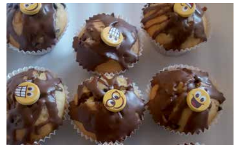
Muffins sind bei den Kids sehr begehrt.