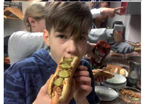
Hot Dogs gegen den großen Hunger.