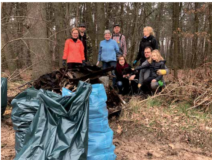
Schon im letzten Jahr wurde aktiv Müll gesammelt.