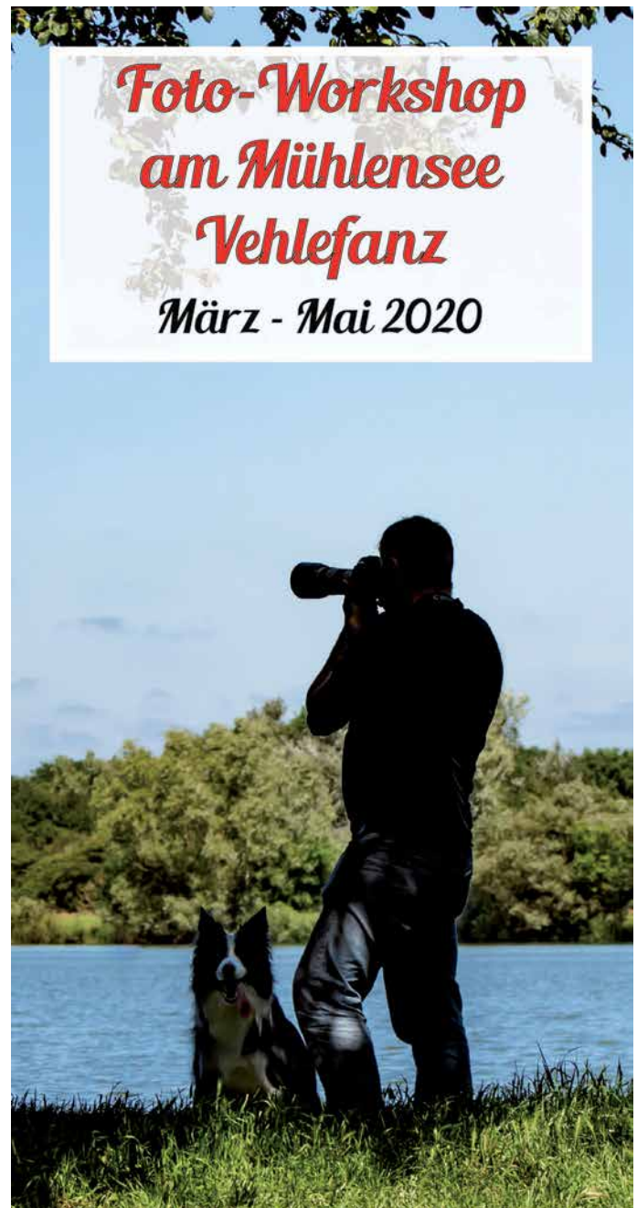
Foto-Workshop am Mühlensee Vehlefan März - Mai 2020

Tourismusinformation Oberkrämer, Lindenallee 71, 16727 Oberkrämer, Tel. 03304 2061227