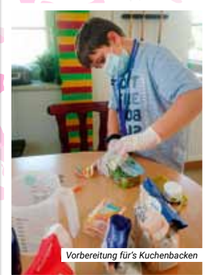
Vorbereitung für's Kuchenbacken