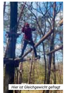
Hier ist Gleichgewicht gefragt

Im Kletterwald CLIMB UP! in Hennigsdorf, durften die Kids zwischen hohen Bäumen auf unterschiedlichen Parcours ihre Kletterkünste unter Beweis stellen.