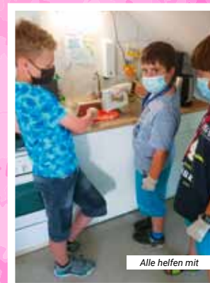
Alle helfen mit

gewünschte Konsistenz hatte und auf's Backblech verteilt werden konnte. Den nach und nach eintrudelnden Clubbesuchern zog der Duft des backenden Kuchens in die Nase und sie freuten sich darauf, auch ein Stück abzubekommen. Die kleinen Bäcker waren sehr stolz, dass der Kuchen so gut ankam und allen schmeckte.