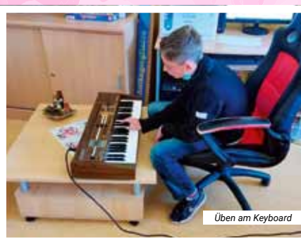
Üben am Keyboard

Wer nach mehr musikalischer Kreativität suchte, konnte sich am Keyboard ausprobieren.