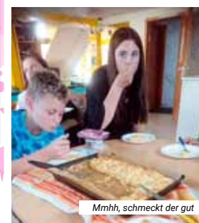
Mmh, schmeckt der gut