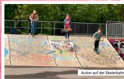
Action auf der Skaterbahn

Es machte viel Spaß, die unterschiedlichen Bahnen zu testen. So viel Aktivität macht hungrig und so wurde der Ausflug durch den Besuch eines Fastfood-Restaurants abgerundet.