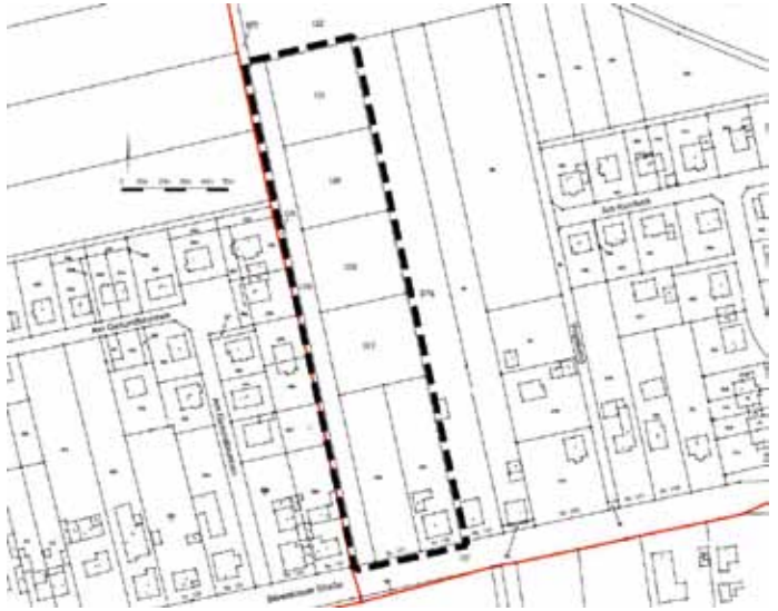
Auszug aus der Liegenschaftskarte

Lageplan mit Umgrenzung des Plangebietes des Bebauungsplanes Nr. 76/2021 „Wohnbebauung Bärenklauer Straße 137 und 139“ im OT Vehlefanz