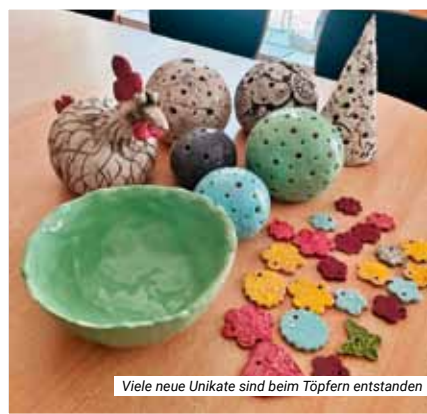
Viele neue Unikate sind beim Töpfern entstanden

In Vehlefanz sind die Besucher und Besucherinnen immer noch mit Feuereifer beim Ausleben ihrer kreativen Ideen beim Töpfern dabei. Unter der Anleitung und mit Unterstützung der Betreuerinnen, entsprechen die Arbeiten den Vorstellungen der jungen Töpfer und Töpferinnen.