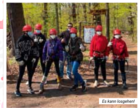
Es kann losgehen!