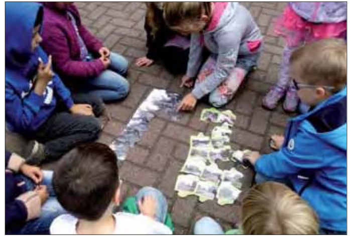
Schnell alle Teile zusammensetzen und dann her mit dem „Schatz“.