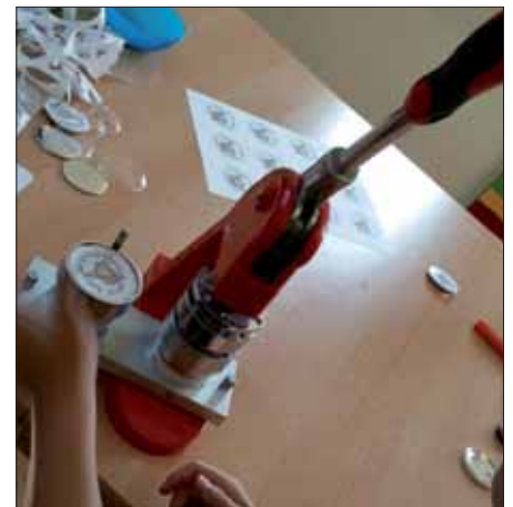
An der Buttonmaschine wurden die Eigenkreationen fertiggestellt.

Mit ihrem Besuch im Club sollen die Kinder ihre Scheu verlieren, diesen in ihrer Freizeit, ab dem 10. Lebensjahr, zu besuchen.