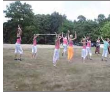
präsentierten nach einigen Übungsstunden dann ihr Programm.