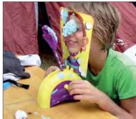
Spaß war angesagt - wie hier mit der Schokokuss-Schleudermaschine.