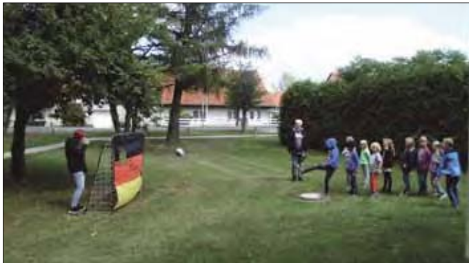
Zeit zum Spielen war auch - Dieser Ball traf... fast.

Diese gelungene Veranstaltung wurde in Zusammenarbeit der Kita Bärenklau und den Mitarbeitern der Jugendarbeit vorbereitet und durchgeführt.