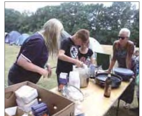
Gemeinsames Kochen unter Anleitung - die Eierkuchen waren lecker.