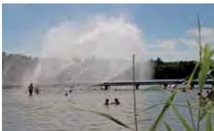
Abkühlung im See mit Wasserfächerfontaine