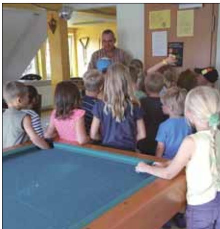
Kleine Einführung und dann Angebote ausprobieren.