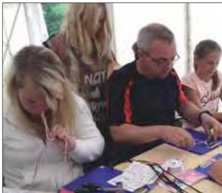
Paracord-Armbänder - gefertigt aus Fallschirmschnüren - individuell und immer chic.