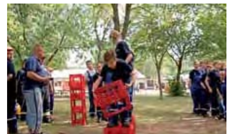
Die Cola-Kisten-Brücke entsteht