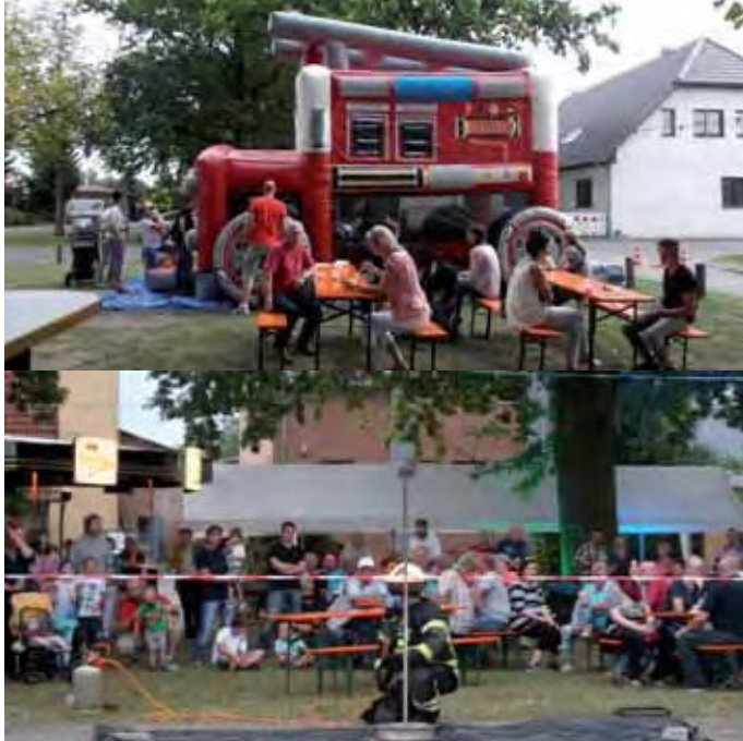
Spiel, Spaß und gemütliches Beisammsein auf dem Dorfanger in Eichstädt

Aber auch der Kindergarten und die Senioren des Ortes engagierten sich mit Kinderspielen und Kuchenspezialitäten. Ebenfalls unterstützten ortsansässige Sponsoren das Fest mit verschiedenen Zuwendungen.