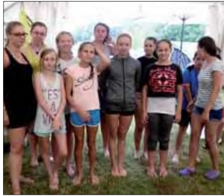
Die Hip-Hopper haben sich gefunden und