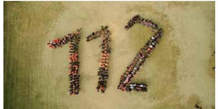
Das Kunstwerk ist geschafft - 112 gestellt aus den Teilnehmern

Sieger wurden unsere polnischen Gäste aus Biala Podlaska, den zweiten Platz belegte die Mannschaft aus Bergfelde und die Hennigsdorfer wurden dritte.