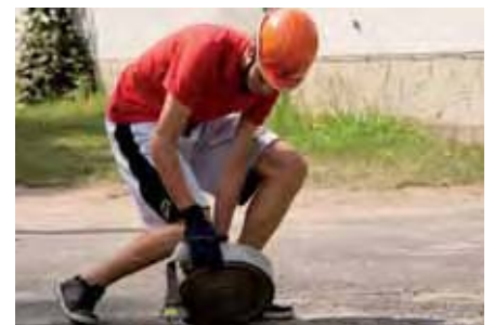
und jetzt ... Schlauchkegeln