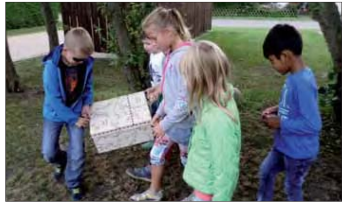
Auf der Suche nach den Puzzleteilen - mit Karte kein Problem