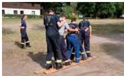
Koordination war Voraussetzung für das Trockenski fahren