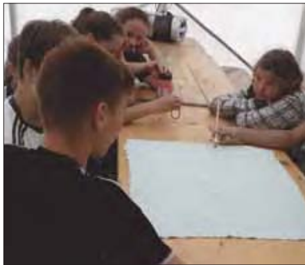
Vorbereitungen für das Geländespiel.

der täglichen Einkäufe mit ihrem Bus der Jugendarbeit unterstützten, sondern auch das Großzelt und die Bierzeltgarnituren zur Verfügung stellten. Aus dieser bereits bestehenden längeren Zusammenarbeit mit der Jugendarbeit Oberkrämer entstand das Logo und das Maskottchen KROK.