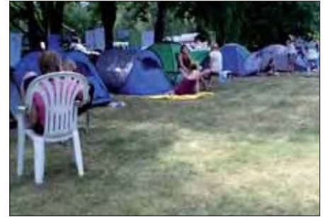
Ferienheimat für eine Woche.

Das Camp wurde gemeinsam mit der Jugendarbeit der Stadt Kremmen durchgeführt, die als Mitarbeiter nicht nur die Vorbereitung und den Transport