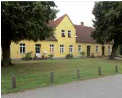
Gemeindehaus Klein-Ziethen Am Dorfplatz 2