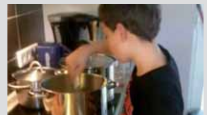
Wie lange muss ich denn noch rühren

Das Schönste kommt dann immer zum Schluss - das zubereitete Essen wird verspeist.