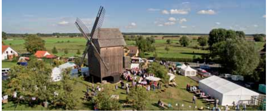
Rund um die Mühle wurde bei schönem Herbstwetter gefeiert

Unter dem Motto „Macht es wie die Müllergesellen, ab auf die Walz“, lud die