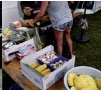
Eine Auswahl der verschiedenen Grillsachen.

Das diesjährige Camp stand unter dem Motto „Mit allen Sinnen“. Die Teilnehmer lernten, wie wichtig unsere Sinne sind. Außerdem erkannten sie die Vorteile alle Sinne nutzen zu können.