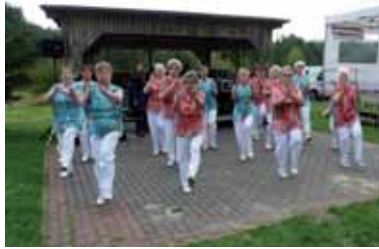
Die „Bärenklauer Spätlese“ beim Krämerwaldfest

Wer neu einsteigen möchte, erhält auf jeden Fall gründliche Unterstützung und besondere Anleitung.