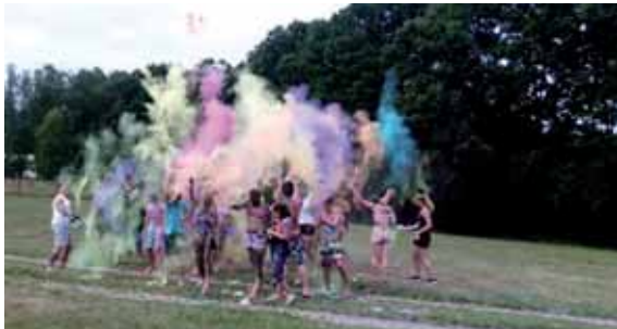
Die Kids machen sich einen „Bunten“ beim Holi-Fest. Dafür wird das Farbpulver in die Luft geworfen.