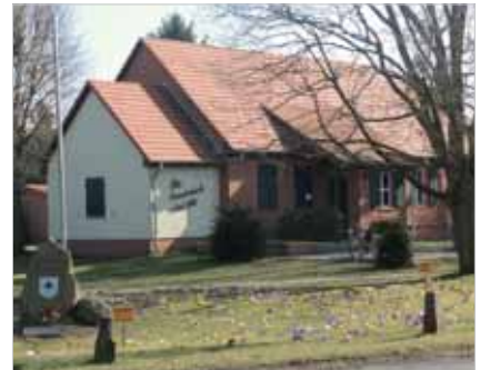
Alte Remonteschule, OT Bärenklau Alte Dorfstraße 15