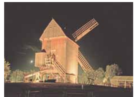
Wunderschön war die Mühle bei Nacht beleuchtet