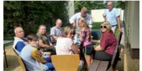
Ferienabschlussparty in Miniformat

Am Ende kamen doch nur ganz wenige Jugendliche um das Feriende zu „feiern“. Vielleicht lag es daran, dass die Ferien mal wieder viel zu schnell vorbei oder sehr viele Kids noch verreist waren. So wurden die nett vorbereiteten Stunden eher wie ein Familientreffen mit den Clubbetreuern.