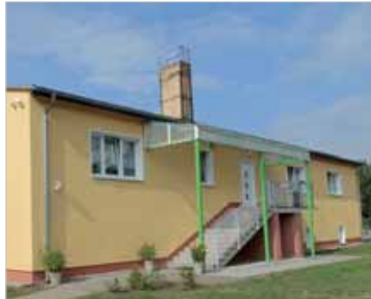
Gemeindezentrum Bötzw Veltener Straße 23