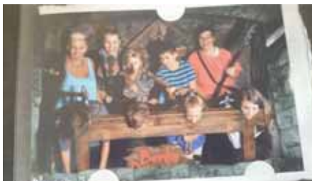
„Probefliegen“ auf der Hinrichtungsbank (alle kamen wohlbehalten zurück)