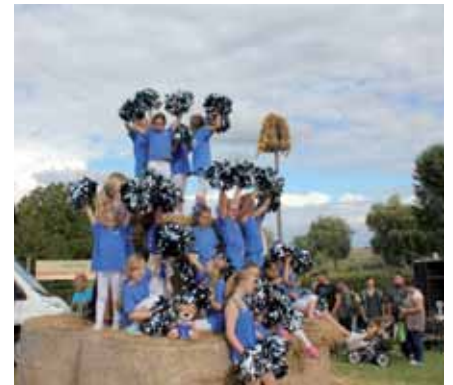
Die Cheerleader aus Hennigsdorf nutzten die Strohbürg für ein Gruppenfoto