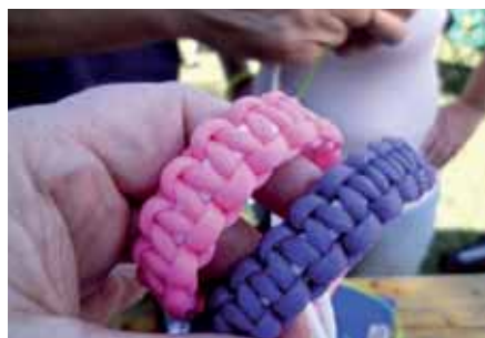
Vielleicht werden im nächsten Camp auch wieder Paracordarmbänder gebastelt. In diesem Jahr waren sie der „Letzte Schrei“

Was sich die Betreuer fürs Camp 2016 ausgedacht haben, das wird noch nicht verraten!