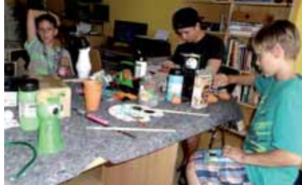
Am Anfang herrschte noch das Chaos

Gebastelt wird bei uns ja fast immer. Diesmal sollten es nur lustige Figuren für die Fensterbank zu Hause werden. Die Kids betätigten sich sehr kreativ und was am Ende entstanden war, erstaunte sogar die anleitenden Betreuer.