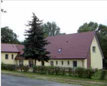
Haus der Generationen, OT Vehlafanz Lindenallee 11