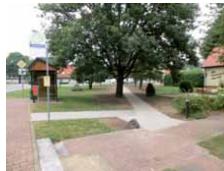
Foto oben: Der verbreiterte Fußweg