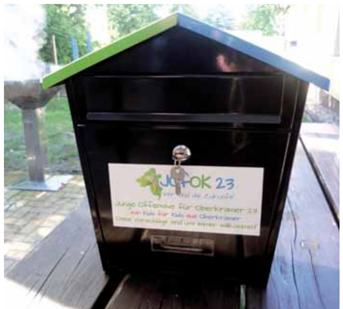
So sehen die JOfOK-Briefkästen aus

Da viele Kinder weder die Tageszeitungen, noch das Amtsblatt lesen, bitten die aktiven Kids der „Jungen Offensive für Oberkrämer“ (JOfOK23) alle Eltern und Großeltern ihren Kindern zu erzählen, dass sie dort die Möglichkeit haben ihren „Wunschzettel“ hineinzuworfen. Mit ihren Briefen an die JOfOKer können sie auf Verbesserungswünsche in ihrem Wohnort oder aber auch an anderen Orten aufmerksam machen, um das sich dann das Kinder- und Jugendgremium sehr gern kümmern möchte.