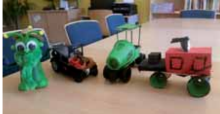
Am Ende waren lustige Figuren entstanden