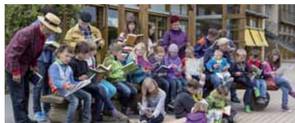
Egal wie alt Sie sind, lesen macht Spaß und wir freuen uns immer auf Ihren Besuch!

Aber natürlich hält Ihre Bibliothek nicht nur alles rund ums lebenslange Lernen für Sie bereit – Leselust und Medienvielfalt für jedes Alter stehen bei uns im Mittelpunkt. Schauen Sie auf unsere Homepage – Neuerscheinungen drehen sich im Medienkarussell für Kinder und Erwachsene und bestellen Sie Ihre Wünsche gleich im Benutzerkonto vor. Gibt es dabei ein Problem – sprechen Sie mit uns.