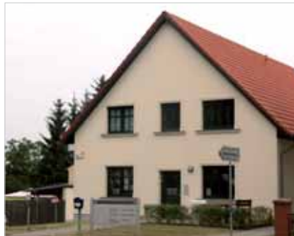
Gemeindehaus Eichstädt Am Eichenring 29