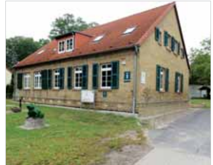
Gemeindezentrum Schwante Dorfstraße 28