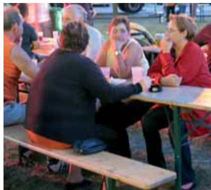
Man traf sich auf ein Bier und zum Plausch

Fürs leibliche Wohl wurde gesorgt, von süß bis herzlich war alles vorhanden.