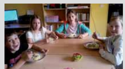
Klopse nach Omas Rezept waren lecker!