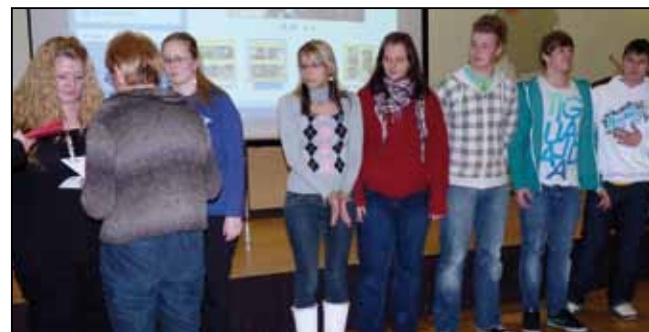
(Jugendliche, die mit dem „Ehrna“ (Ehrenamtsnachweis) für besonderes Engagement geehrt wurden)