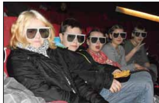
Besuch 3D-Kino am Potsdamer Platz