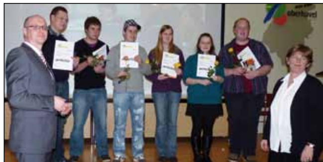
(Jugendliche, die 2010 ihren Jugendleiterausweis („JuLeiKa“) bekommen haben)

Die Jugendleiter-Karte ist eine gewichtige Anerkennung der ehrenamtlichen Arbeit dieser engagierten jungen Menschen. Sie ist auch ein Leistungsnachweis ihres pädagogischen Könnens und Wissens. Die „Juleika“ baut Vertrauen auf bei den Kids, den Jugendlichen, deren Eltern und beim Träger der Jugendclubs. Sollte Sozialpädagogik die Berufswahl der jungen Menschen sein, so versichert die „Juleika“ dem zukünftigen Arbeitgeber, einen engagierten, zuverlässigen Jugendlichen mit uneigennütziger Einsatzbereitschaft vor sich zu haben. Mit Bildern, Sketchen, Musik, Streetdance und Akrobatik wurde die fröhliche Feier für die insgesamt 26 ausgezeichneten Jugendlichen aus ganz Oberhavel aufgelockert gestaltet.