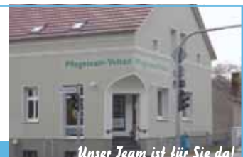
Unser Team ist für Sie da!

Bürozeiten: Mo.–Fr. 7.00–15.00 Uhr und nach Vereinbarung