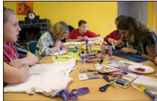
Kreativworkshop mit Kochen in Vehlefanz

Kleiner Ausschnitt aus unserem Winterferienprogramm!