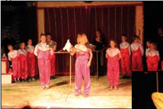
Künstler aus der Gruppe der Taubenrevue

Die Vorstellung in der Manege sorgte für rege Begeisterung bei den Zuschauern und die Schülerinnen und Schüler ernteten viel Applaus.