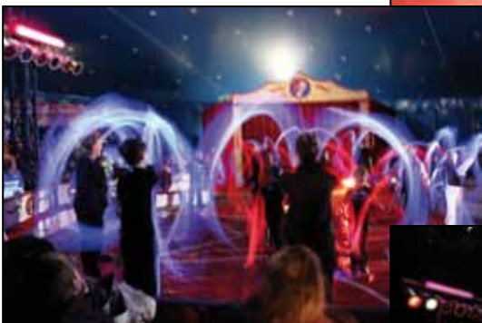
Aus der Revue Schwarzlichtshow und Piratenshow unsere Schwarzlichtkünstler