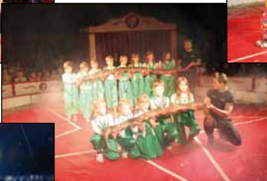
Mutige Künstler aus der Gruppe der Schlangenrevue.