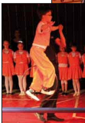
Die Gruppe der wagemutigen Seiltänzer