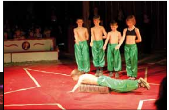
Die Gruppe Schlangen / Fakir / Feuer und Haustierrevue – hier die mutigen Fakire