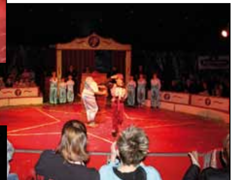
Unsere gefährlichen Piraten aus der Piratenshow.