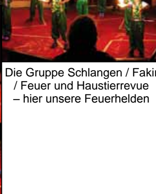
Die Gruppe Schlangen / Fakir / Feuer und Haustierrevue – hier unsere Feuerhelden