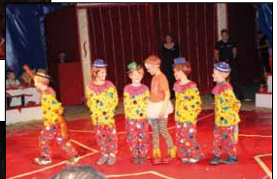
Die Gruppe Clowns und Zauberei – hier unsere Clowns