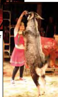
Die Gruppe Schlangen / Fakir / Feuer und Haustierrevue – hier die Haustierrevue