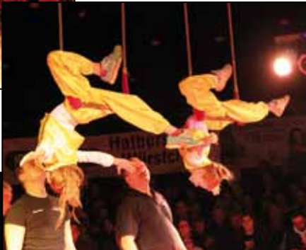
Die Gruppe Jongleur / Lasso und Trapez – hier die Trapezkünstler