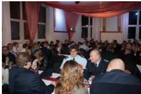
Unsere Kameraden der Freiwilligen Feuerwehr.