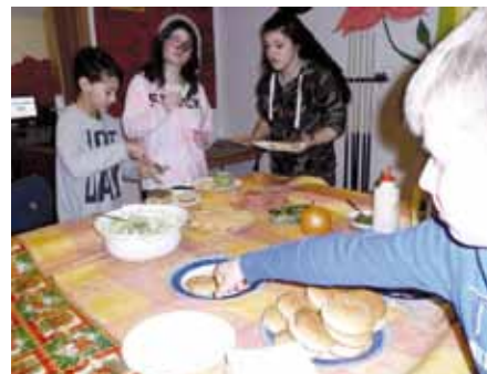
Die leckeren „Oberkrämer-Burger“ werden kreiert.

Somit stand am Ende der Ferien erneut das Genießen auf dem Plan - ein super Ferienangebot!