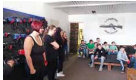
Bequeme, sportliche und dunkle Kleidung an, das notwendige Equipment anlegen und dann geht der Spaß los.

Der Besuch beim LASERTEC Berlin wurde zu einer enormen Herausforderung. Sportliche Fitness, Konzentration und Teamfähigkeit waren nötig, um das Geländespiel in völliger Dunkelheit mit Lasertechnologie absolvieren zu können.