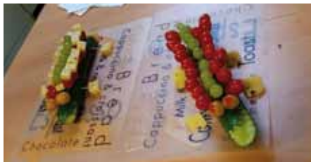
„Das Auge isst mit“, so schmeckt's gleich noch besser.

Jeden Montag findet im Jugendclub in Schwante zurzeit ein Kochkurs statt. Am 20.02.2017 probierten die Kinder „Gemüse mal anders“.