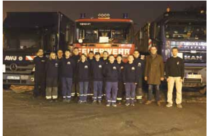
Die Jugendfeuerwehr Bötzw bedankt sich mit diesem Foto.

Am Mittwoch, den 25.01.2017 trafen sich die Angehörigen der Jugendfeuerwehr aus Bötzw mit den Hauptsponsoren zum Fototermin, um sich auf diese besondere Art zu bedanken.