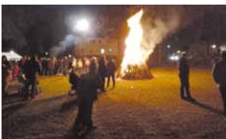
Zum Abschluss des Jubiläumsjahres wurde ein Winterfeuer entzündet.