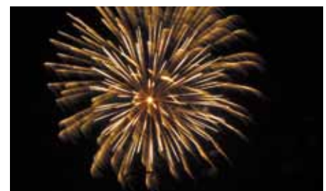
Zum Abschluss gab es dann ein Feuerwerk.