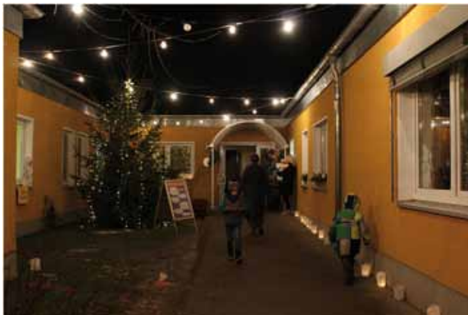
Ein bisschen Weihnachten hatten wir aber doch noch.

Frau Weber gab in einer Ausstellung mit Holzpuzzle Einblicke, welche Vorzüge ein Wald im Winter hat und was es dort schönes zu entdecken gibt.