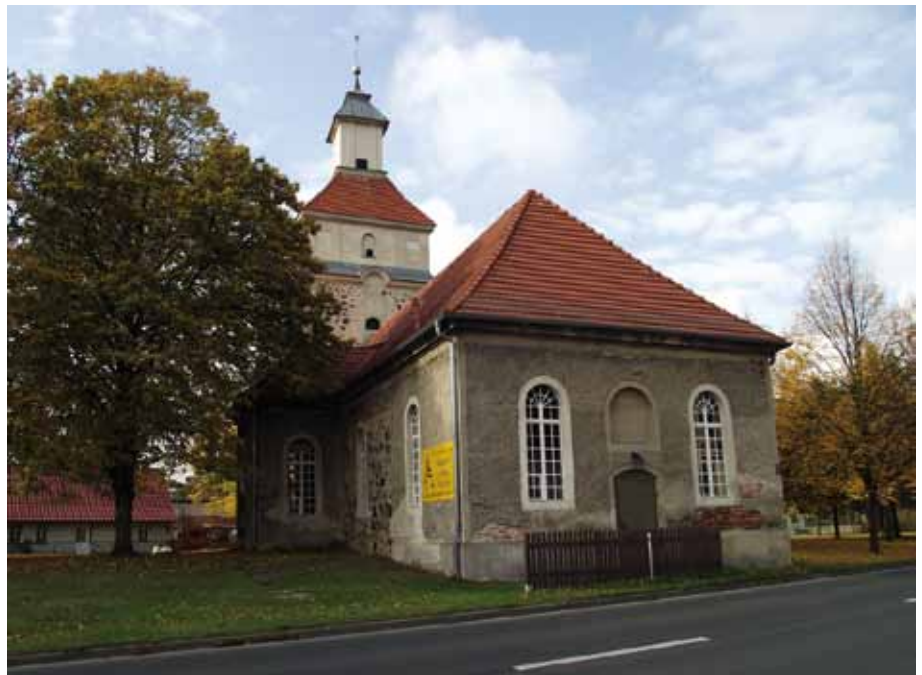
In und um die Kultur- und Kinderkirche treffen sich die Eichstädter zum Feiern und viele kulturelle Veranstaltungen finden hier statt.