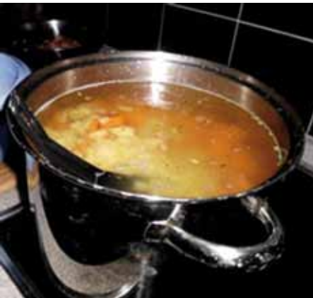
Selbst gekocht - schmeckt sowieso.