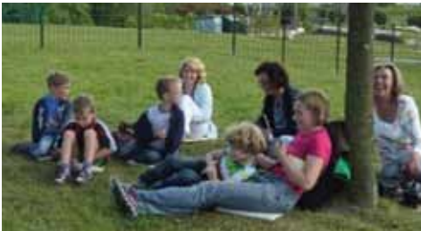
Vorlesen, auch mal im Freien, macht nicht nur den Kindern Spaß