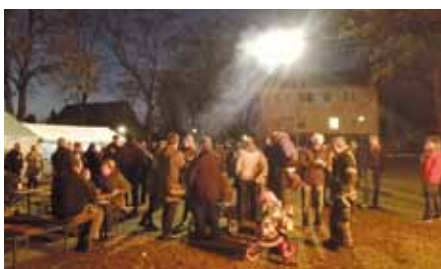
Groß und Klein versammelte sich auf dem Dorfanger.

Im letzten Jahr feierten die Vehlefanzer die erste Erwähnung von Vehlefanze vor 775 Jahren.