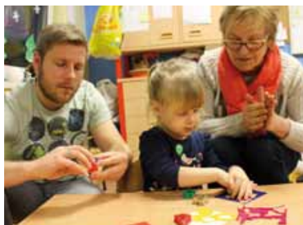
Foto oben: Stockbrot an der Feuertonne immer lecker. Foto unten: Gebastelt haben nicht nur die Kleinen.