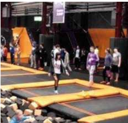
Im Angebot: FoamJUMP, BagJUMP, FreeJUMP, SlamJUMP, 3D Dodgeball und eine American Gladiator Battle Box - also Trampoline wohin man schaut.

Ein Besuch im JUMP House Berlin, Deutschlands größtem Trampolinpark, ermöglichte den Teilnehmern sich mal so richtig auszutoben. Das JUMP House ist eine riesige Trampolinwelt mit sieben Sprung- und Spaßbereichen und ca. 120 Trampolinen für jeden Geschmack und jedes Alter ein tolles Erlebnis!