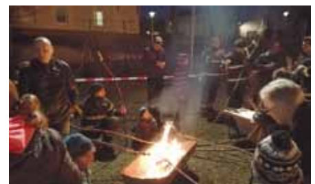
Stockbrot wurde an der Feuerschale zubereitet.

Ein wunderschönes Feuerwerk am Himmel von Vehlefanze bildete den glanzvollen Schlusspunkt des ereignisreichen Jahres.