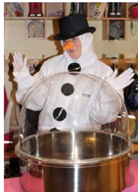
Weiß und süß - Zuckerwatte vom Schneemann.

Schließlich lud die Feuertonne zum Stockbrotbacken und Verweilen zum gemütlichen Ausklang ein.