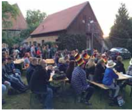
Beim Public Viewing

Das mit Spannung erwartete traditionelle Tauziehen wurde erwartungsgemäß von den Kamereaden der Freiwilligen Feuerwehr gewonnen. Einen großen Zuspruch fand auch die Jubiläumstombola mit ihren Preisen im Gesamtwert von ca. 3.000 Euro, zu denen erfreulicherweise insgesamt 63 Gutscheine gehörten. Dafür möchte ich mich nicht