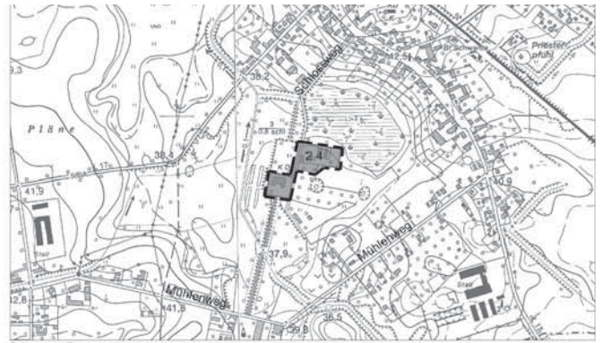
Übersicht Änderung 2.4 im Bereich OT Schwante – Schlosspark M 1:10.000

Eine Verletzung der in § 214 Abs. 1 Satz 1 Nr. 1 bis 3 BauGB bezeichneten Verfahrens- und Formvorschriften ist unbeachtlich, wenn sie nicht innerhalb eines Jahres seit der Bekanntmachung der Änderungen und Ergänzungen des Flächennutzungsplanes der Gemeinde Oberkrämer schriftlich gegenüber der Gemeinde unter Darlegung des die Verletzung begründeten Sachverhalts geltend gemacht worden ist (§ 215 (1) BauGB).