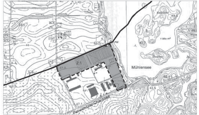
Übersicht Änderung 2.1 im Bereich OT Vehlefanz - Gewerbegebiet Perwenitzer Chaussee M 1:10.000