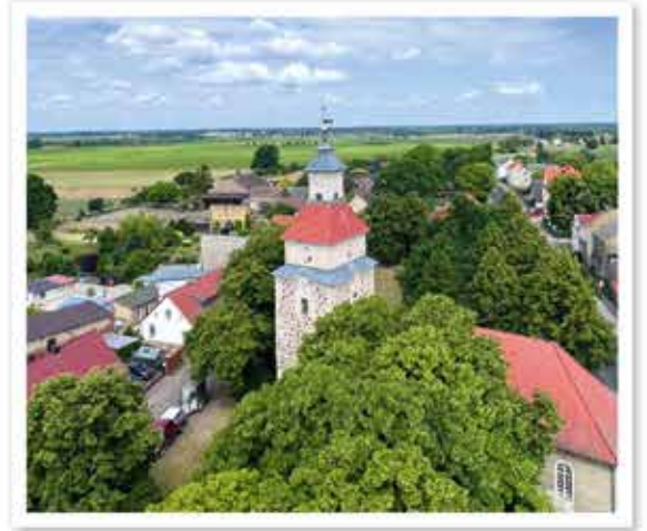
Die Dorfkirche in Eichstädt ist eine mittelalterliche Feldsteinkirche, erbaut im 14. Jahrhundert.

Geteilter Schild, darin eine schwarze Dreiplattennadel. Oben drei rote Platten mit silbernem Kreuz und fünf schwarzen Punkten. Links in Grün ein silbernes Eichenblatt mit Frucht, rechts ein fliegend stürzender silberner Schwan. Die Dreiplattennadel verweist auf einen Fund von 1894. Das Eichenblatt spielt auf den Ortsnamen an, der Schwan erinnert an die frühere Schwanenbelegung des Uppstallpfuhls.