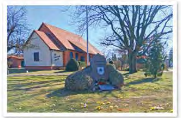
Das Gebäude der Remonteschule ist heute Begegnungsstätte.

Das Wappen von Bärenklau ist ein „redendes Wappen“ – es nimmt Bezug auf den Ortsnamen und symbolisiert die enge Verbindung zur Geschichte.