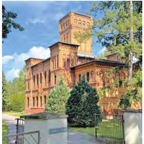
Gebäude im Ensemble vom Schloss Sommerswalde

Die beiden Frösche verweisen auf die Sage von den stummen Fröschen aus Schwante. Der rote Wellenbalken mit drei Sternen nimmt Bezug auf das Wappen der Familie von Redern, die Schwante vom 14. bis 19. Jahrhundert besaß. Das Wappen zeigt einen roten Schild mit weißem Schrägrechtsbalken und drei goldenen Sternen; die Wellenform erinnert an einen früheren See. Die drei Sterne stehen zugleich für die Ortsteile Schwantes: Dorf Schwante, Neu-Schwante mit dem ehemaligen Vorwerk Kuckswinkel und Sommerswalde.