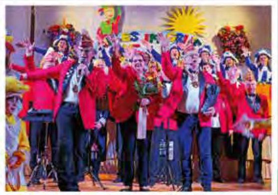
↑ Marwitzer Carneval Club 1972 e. V.