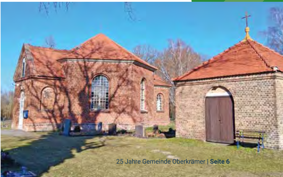
← Die sechseckige Kapelle in Bärenklau

Viele Neubürger fanden hier ihr Zuhause und prägten den Ort neu.