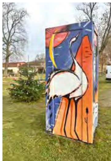
Bücherzelle auf dem Dorfplatz

Osterfeuer Sommerfest viele kleine Veranstaltungen Vereinsleben Herbstfest Spieleabende im Gemeinderaum Garagenflohmarkt Gemeinsame Ausflüge der Senioren