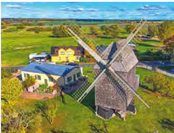
Tourismusinformation an der Bockwindmühle