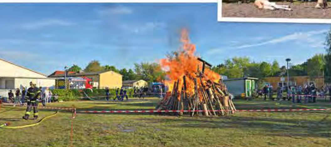
← Feuer zur Walpurgisnacht