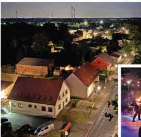
↑ Gemeindefest Eichstädt