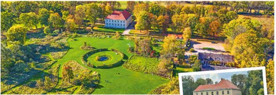
Schlossgut Schwante mit Skulpturenpark