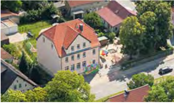
Kita „Zwergenland“ in Eichstädt