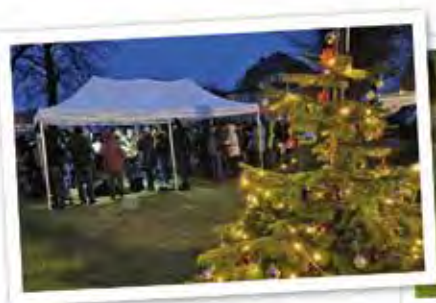
Bläserklänge beim Baumschmücken auf dem Dorfplatz zur Weihnachtszeit