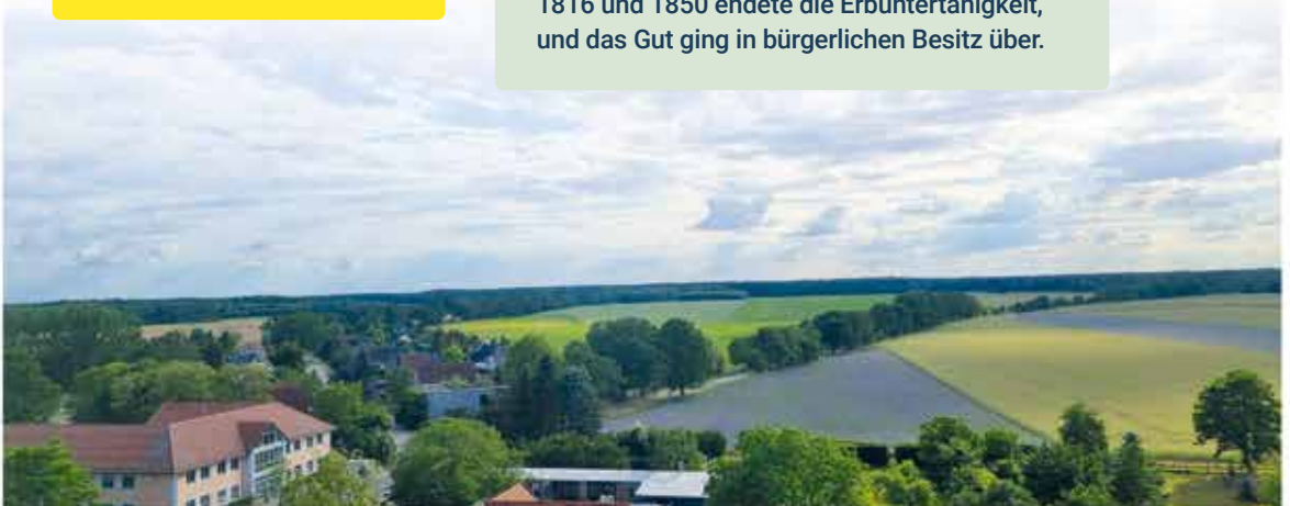
Verwaltungsgebäude von Oberkrämer in Eichstädt

1793 wurden fünf Rittergüter zu einem Gut zusammengeführt. Nach einem Brand 1814 wurde die Kirche Filiale von Marwitz. Zwischen 1816 und 1850 endete die Erbuntertänigkeit, und das Gut ging in bürgerlichen Besitz über.