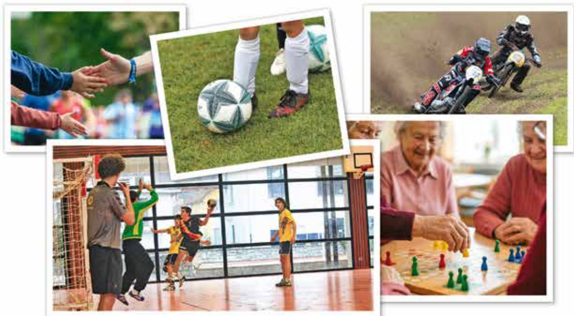
viefältiges Vereinsleben in Oberkrämer