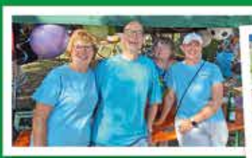
SG „Deutsche Eiche“ Marwitz e. V.