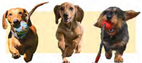
DACKELRENNEN IN BÄRENKLAU

Ein besonderes Highlight für alle Dackelfans ist das alljährliche Rennen der kurzen Beine.