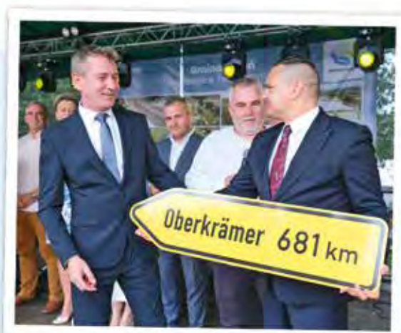
Besuch der polnischen Partnergemeinde Kotuń 2025