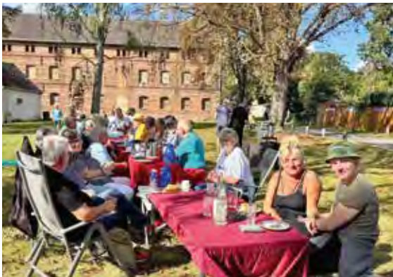
Kaffeetafel auf der Kastanienwiese