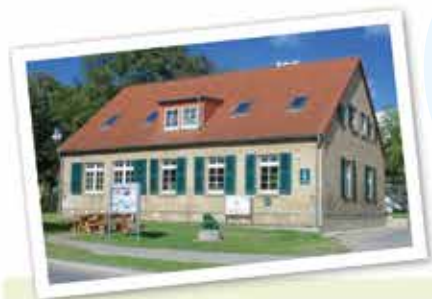
← Gemeindezentrum Schwante