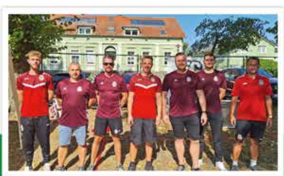
Fussballclub Marwitz 09 e. V.