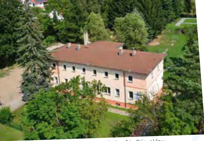
Kita „Zum lustigen Bärenvölkchen“ in Bärenklau