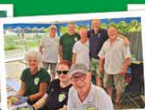
Angelfreunde Marwitz 1962 e. V.