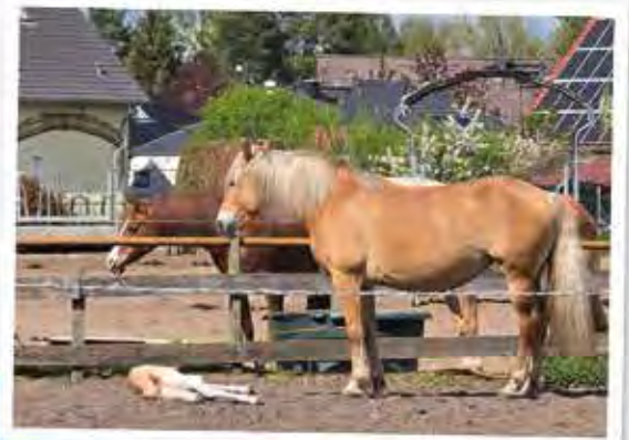
↑ Pferdekoppel in Bötzw

So entwickelt sich Bötzw in den letzten 25 Jahren vom ruhigen Dorf zu einem stark wachsenden Wohnort. Neue Wohngebiete entlang der Veltener Straße werden erschlossen und durch Zuzug junger Familien ist das heutige Erscheinungsbild geprägt worden.