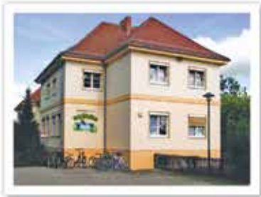
Kita „Villa der kleinen Frösche“

In unmittelbarer Nähe zum Regionalbahnhof befindet sich das Gesundheitszentrum Schwante mit Arztpraxen, Apotheke und Physiotherapie. Durch die gute