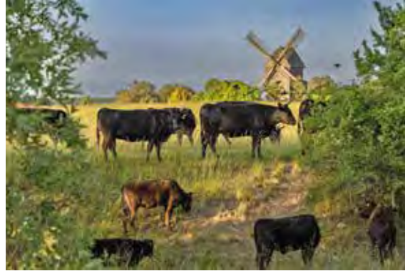
freilaufende Rinder am Mühlensee

Im Zentrum die Windmühle als Wahrzeichen des Ortes. Der abgeflachte Berg im Schildfuß verweist auf den slawischen Burgwall Botscheberg. Der Wellenbalken symbolisiert den prägenden Mühlensee. Das aufgelegte Wappenschild stellt die Verbindung zur Familie von Bredow dar. Pflug und Hufeisen repräsentieren die Ortsteile Karlsruhe und das frühere Remontedepot Koppehof.