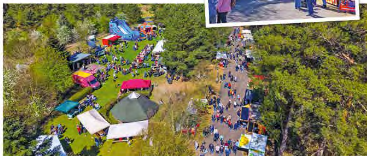
Das Krämerwaldfest findet jedes Jahr mitten im Wald statt. Besucherinnen und Besucher genießen die Natur, ein abwechslungsreiches Kinderprogramm, kreative Angebote zahlreicher Kunst- und Kleinhändler sowie eine vielfältige gastronomische Auswahl.