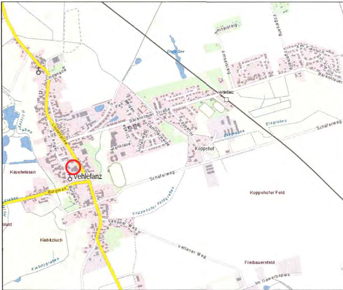
Übersichtskarte (ohne Maßstab)