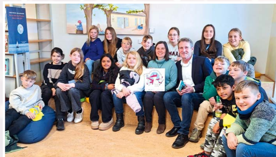
Der Bürgermeister hat einer begeisterten Klasse beim Bundesweiten Vorlesewettbewerb vorgelesen und gratuliert der Bibliothek zum Gütesiegel „Bildungspartner. Ausgezeichnet!“.

Die Öffentlichen Schulbibliotheken Oberkrämer sind „Bildungspartner. Ausgezeichnet!“. Das Qualitätssiegel wurde am Freitag, den 21. November 2025 vom Landesverband Brandenburg im Deutschen Bibliotheksverband e.V. feierlich verliehen. Es ehrt die Bibliotheken in Vehlefanz und Bötzw für ihre vielfältige Bildungs- und Projektarbeit mit Grundschulkindern zur Leseförderung und Wissensvermittlung und zeichnet sie als wertvolle Bildungspartner aus.